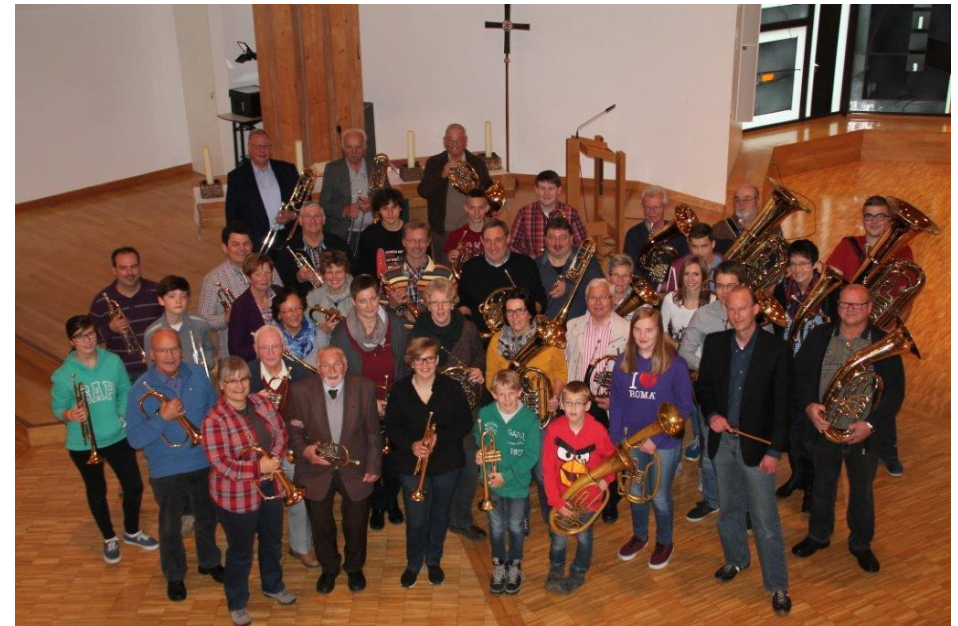
Posaunenchor Lemgo im Jubiläumsjahr 2014