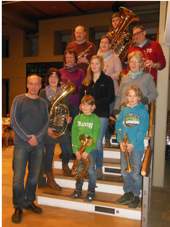
Unser Bläsernachwuchs im Jahr 2015

Der Förderverein bezweckt, die Arbeit des Posaunenchores Lemgo ideell und materiell zu unterstützen, da er die Arbeit des Posaunenchores Lemgo sowohl als wichtigen Bestandteil der Kirchengemeinden St. Johann, St. Marien, St. Nicolai und St. Pauli als auch des kulturellen Lebens in der Stadt Lemgo ansieht.